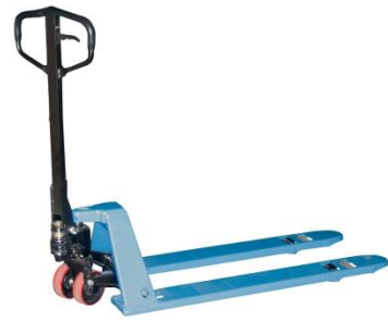
Surbaissé 54 mm