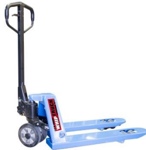
Fourche 800 mm